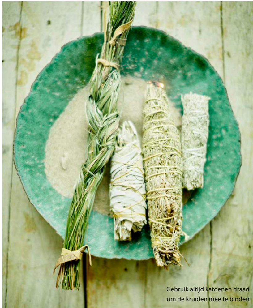
Gebruik altijd katoenen draad om de kruiden mee te binden